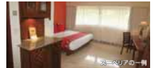
※詳しくはお問い合わせください。