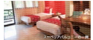
↑スーベリアにバルコニーがついたタイプです。