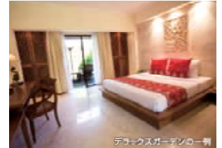
↑ご利用無料特典があります。