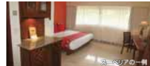
※詳しくはお問い合わせください。

ルームタイプでのご利用に限ります。※お申し込み前に必ず、「ご案内とご注意(抜粋)」「旅行条件(抜粋)」をお読みください。※出発地・出発日・ツアー行程の異なる方同士の間室はお受けできません。※ルームタイプはお選びいただけますが、混雑状況によりご希望に添えない場合がございます。※スイートルームは本キャンペーンに適用となりません。※ビジネスクラスの設定はありません。※延泊不可となります。※1名1室利用お1人様1泊追加料金:10,000円,1名1室をお受けできない期間やルームタイプもございます。詳しくはお問い合わせください。※安全上、12歳未満のお子様のみでの1名1室利用はお受けできません。