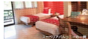
↑スーベリアにバルコニーがついたタイプです。